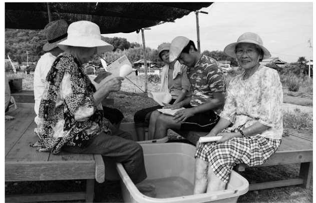
「木を切る話」作品となった足湯に集まってきた島の人たち