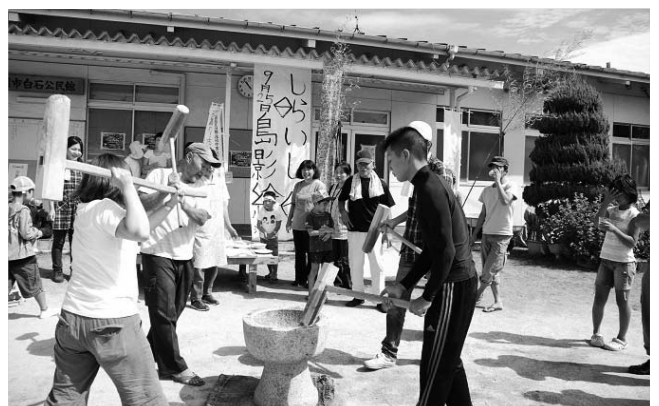
島に伝わる「餅つき唄」を披露しながらの餅つき