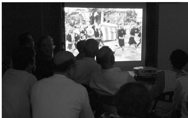
開龍寺での上映会「白石島の記録と記憶」

海からやってきた多様な価値や文化を柔軟に受け入れ、原風景を後世に伝えようと生き生きと暮らす人の中にこそ新しい価値がある。ここで覚醒し、成熟していく。本当に大切なものを考えさせてくれる時間が、確かに存在していた。