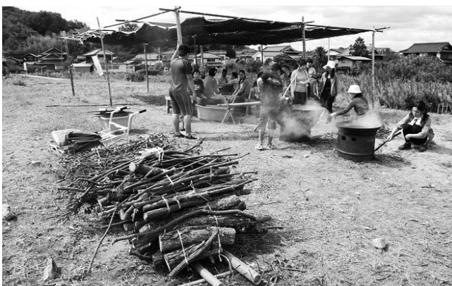
「木を切る話」全景、切り出した木と作品場所の畑

私たちが、笠岡諸島の人たちと関わり始めたのは、10年前にさかのぼる。笠岡市内の福祉施設の人たちと行ったワークショップが出会いだった。回数を重ねる