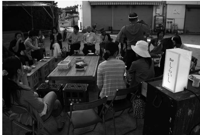
Bar しらいしでのシマポジウム 島の果実や魚を味わいながらのトーク

時代」の島にこだわりながら、進められた。戦後の食糧難のころは、島の土地すべてが畑で木々は薪として使われ、島の御影石が白く光って美しく見えていたという。「どの岩がよく見えると嬉しい？」がらエビの皮をむきながらのお婆ちゃんとの話から生まれたのが『木を切る話し』だ。妙見信仰が残る皇国岩の雑木を切り、島の中央にある畑に運び、湯を焚き「足湯」にした。